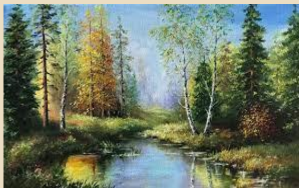
“Осінній ліс” О.Найда