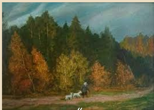
«Вечір біля лісу» В. Титуленко