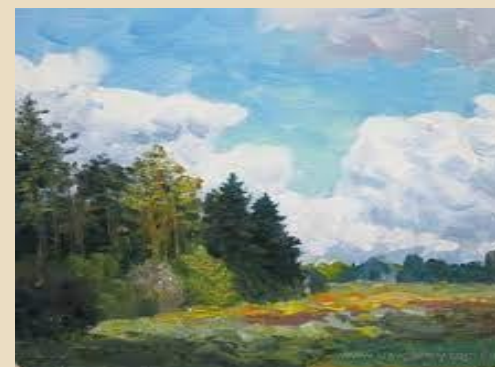
“Ліс і хмари” В. Титуленко